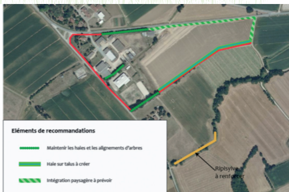
Éléments de recommandation pour la future zone à urbaniser

L'évaluation environnementale des documents d'urbanisme est une démarche de projet en constante évolution encadrée notamment par les lois SRU, Grenelle, ALUR qui vise à minimiser les impacts négatifs du plan sur l'environnement et le cadre de vie. La grande majorité des collectivités souhaitant adopter ou modifier leur projet de territoire est soumise à cette procédure.