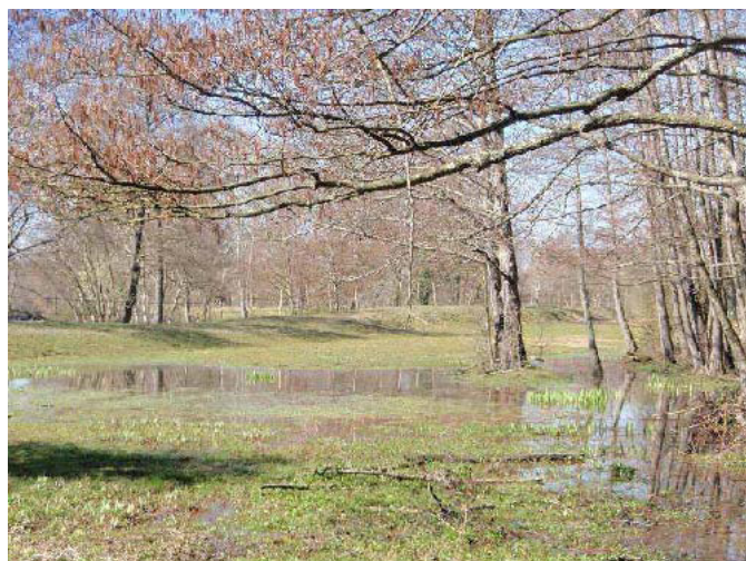
Δ Identification des habitats naturels de la vallée de l'Isle